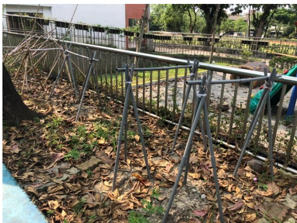
食農教育區一（藤架區）