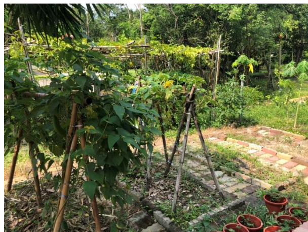
食農教育區二(土種區)