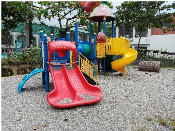
園家聯誼休閒動物樂園場